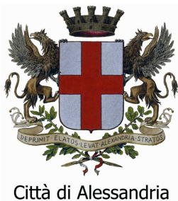
Città di Alessandria